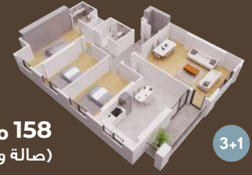
158 متر (صالة و 3 غرف)