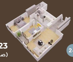
123 متر (صالة وغرفتين)