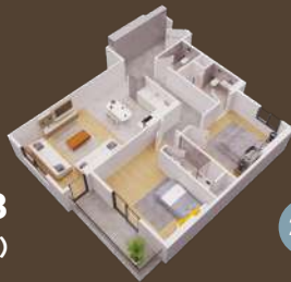
118 متر (صالة وغرفتين)