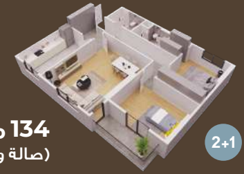
134 متر (صالة وغرفتين)