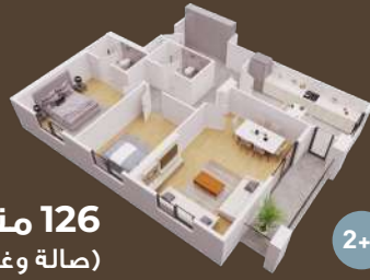
126 متر (صالة وغرفتين)