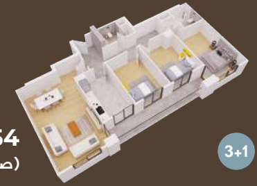
154 متر (صالة و 3 غرف)