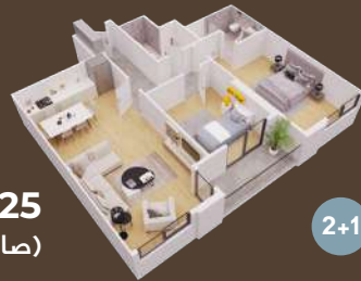
125 متر (صالة وغرفتين)