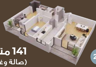
141 متر (صالة وغرفتين)